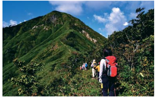
頂上直下の急登を見上げる

地球温暖化で百年後には立ち枯れてしまうのではないかと危惧されているブナ林は、北海道渡島半島の付け根の黒松内町に北限がある。ここに地元の人が「北海道のマッターホルン」と呼んで親しんでいる黒松内岳がある。遠くから見ると、左右対称に迫り上がって、少し太ったマッターホルンに見えなくもない。