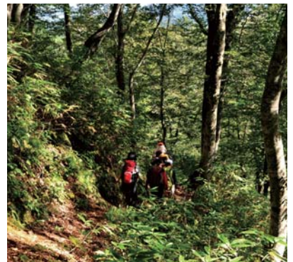
ブナ林北限の散策コース

札幌から国道5号線（札幌〜小樽〜函館）を、ニセコ山系と羊蹄山の間を南下する。この国道は比較的空いており走りやすい。小樽から24 kmのところの右に、黒松内町に入る分岐がある。JRの高架を渡り400 m進んで左に分岐する道を入り、更に100 mほど進むと左側に林道が伸びている。入り口に駐車場があり「黒松内岳登山道入口」の看板が出ている。ここから林道に入り5 km進むと登山口がある。林道の途中に大きな分岐があるが左側の沢筋を進む。登山口から少し急な登りがあるが、距離も短くそう大きなアルパイトを要さない。ここはブナの北限と言われるところで、まもなく