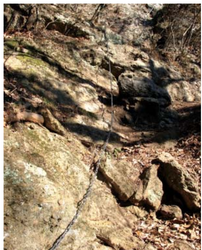
鍬柄岳頂上直下の岩壁に続くクサリ場

上信電鉄の千平駅 せんぺい を下車したら線路を渡り、関東ふれあいの道を行き、鍬柄岳登山口に出る。車の場合は登山口の少し先の右側に駐車スペースがある。杉林を上り岩