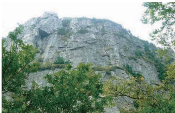
特異な山容の縫道石山 登山道は右から背後に回り込む

縫道石山は下北半島の西に位置する岩峰である。少し離れたところから見ると、その鋭い岩峰に圧倒される。この山はロッククライミングの対象ともなっており、弘前ルートなどいくつかのルートが開拓されている。山を望見したときは、普通の登山者が本当にこの山に登ることができのだろうかと思ってしまうが、山の東側にそういう登山者のための登山道ができていて、ここではそのルートを紹介したい。 登山口は佐井村の福浦地区から福浦川に沿った林道を5kmほど入ったところにある（10台ほど駐車可）。駐車場には誰でも利用できるように熊除けの鈴が置いてある。登山道は途中、福浦地区と野平地区を結ぶ道と交差（野平分岐）するが、道標があり迷うことはない。野平分岐を過ぎると、倒木に行くと手を阻まれる。それを跨いだり、くぐったりしながら先に進む。山が近づいてくると、木々の間から急峻な岩肌が見え、この先本当に登ることができるのか、再び不安になるが、岩壁に沿った道は