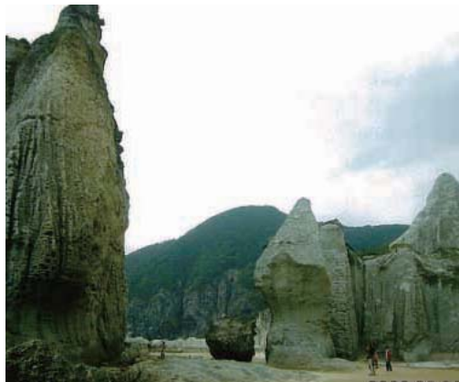
巨石が立ち並び約3kmの仏ヶ浦は水上絶『飢餓海峡』の舞台になった

しつかりしており、慎重に歩を進めて行けば誰でも山頂にたどり着くことができる。山頂は岩でござついで眺望を楽しめる。360度の眺望を楽しむことができる。なお、山頂付近にはオオウラヒダイワタケという地衣類が生えている（岩に黒っぽく張り付いている）。これは天然記念物に指定されている地衣類なので、採取したり、踏みつけたりしないようにしたい。 時間があれば近くの仏ヶ浦の散策をお勧めしたい。福浦地区から国道338号線を南に8kmほど向かったところに、仏ヶ浦への下り口がある。津軽海峡に面したその景観はまさに浄土の世界そのものだ。